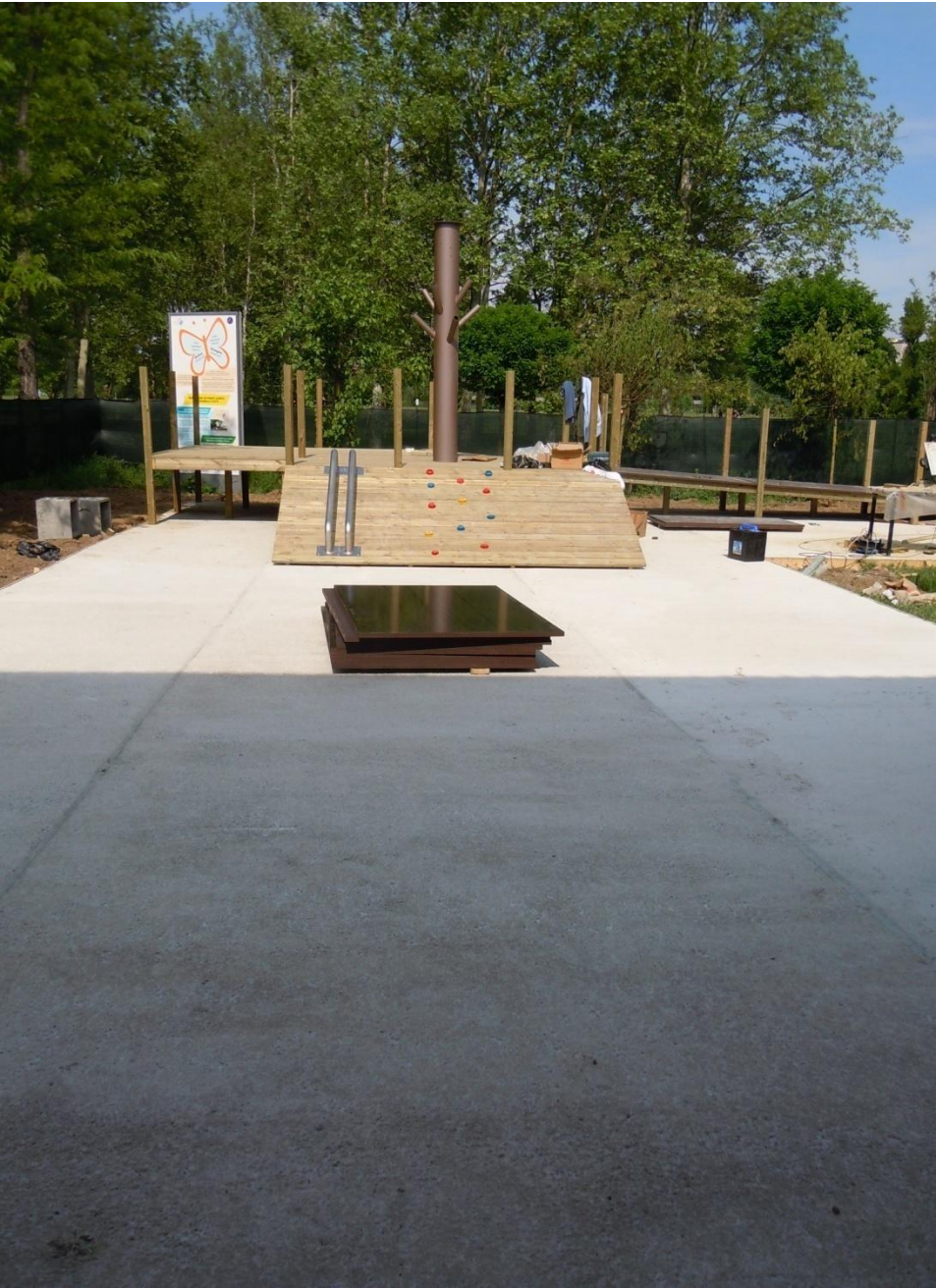
Rampa e pedana in legno